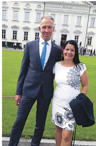
Schöne Momente gemeinsam genie- ...ßen. Hier beim Bürgerfest des Bundes- ...präsidenten vor dem Schloss Bellevue.