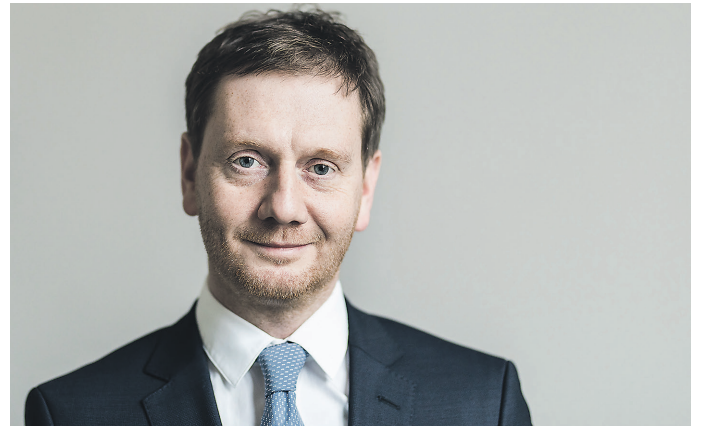
Ministerpräsident Michael Kretschmer: „Wählen Sie Jens Lehmann! Er hat bewiesen, dass er in Berlin viel für Leipzig bewegen kann.“

Uns geht es darum, Verantwortung zu übernehmen und Entscheidungen für unsere Heimat zu treffen.