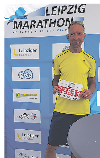
Heute sehe ich den Sport als Ausgleich und Entspannung vom Alltag.

Wir haben uns danach zum Eisessen in der Pinguinbar getroffen und sind später auch ins Kino Capitol gegangen.