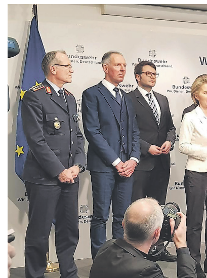
„Die Cyberagentur ist Leipzigs Chance, Innovation zu werden.“ Jens Lehmann zusammen mit Bundesverteidigungsministerin von der Leyen und den Ministern der Verkündung des zukünftigen Standortes der

Das verstehe ich als meine Aufgabe als Politiker – Kontakte unter Fachleuten herzustellen, damit zukunftsweisende Ideen von der Politik gefördert und für die Menschen in die Wirklichkeit umgesetzt werden können.