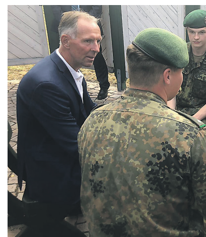
Wer mit den Soldaten vor Ort spricht, erfährt die Herausforderungen der Regierung und Parlament die Ausrüstung der Bundeswehr.