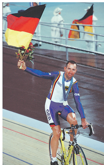
Olympiasieger für Deutschland zu werden ist ein erhebender Moment.