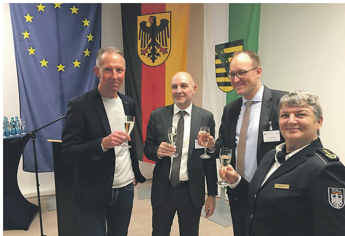
Nach langem Leerstand hat das ehemalige Bundeswehrkrankenhaus eine neue Zweckbestimmung: Es wurde zum Ausbildungszentrum für den Zoll ausgebaut.