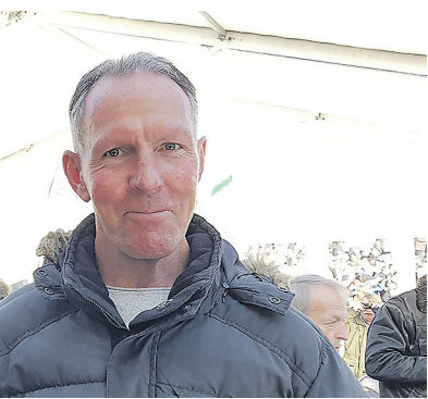
...n traf Markus Söder in Garmisch-Partenkir- ...wie ich.“, sagte er anschließend gutgelaunt.