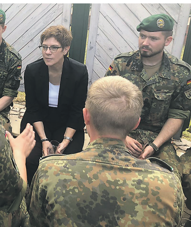
...rekt, wo der Schuh drückt. Nur so können ...undeswehr verbessern.

” Wir unterstützen Jens Lehmann, denn wir sind der Meinung, dass Eigenschaften, die ihn zu seinen Olympiasiegen geführt haben, auch in der deutschen Politik vertreten sein sollten.