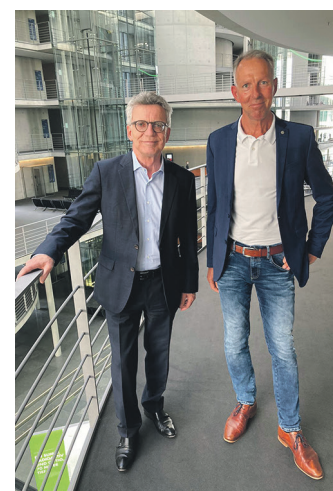
Thomas de Maizière ist mir Vorbild als Politiker, insbesondere in seiner Loyalität, Bescheidenheit, Zielstrebigkeit und Menschlichkeit. Er ist immer Ansprechpartner.