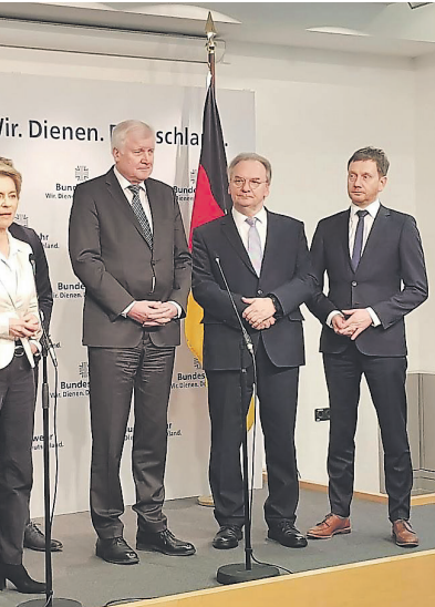
...ionszentrum der deutschen Cybersicherheit ...desinnenminister Seehofer, der damaligen Ver- ...ministerpräsidenten Kretschmer und Haseloff bei ...r Agentur.