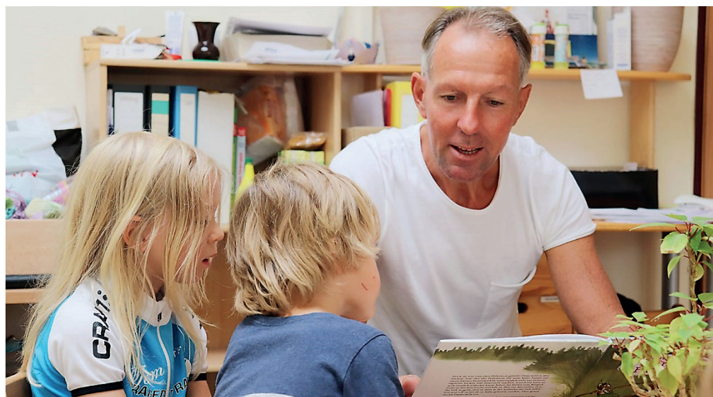
Erzieher ist mein Traumberuf. Auch als Bundestagsabgeordneter versuche ich einmal im Monat in der Schule zu sein, was jedoch durch die Pandemie im vergangenen Jahr leider nicht möglich war.