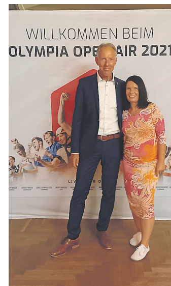
Wir freuen uns immer sehr, die große Sportfamilie Leipzigs zu treffen, wie zum Beispiel hier beim Olympiaball.