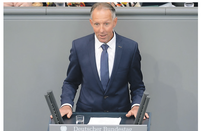
Diskutieren, streiten, Argumente austauschen – Jens Lehmann am Rednerpult des Deutschen Bundestages