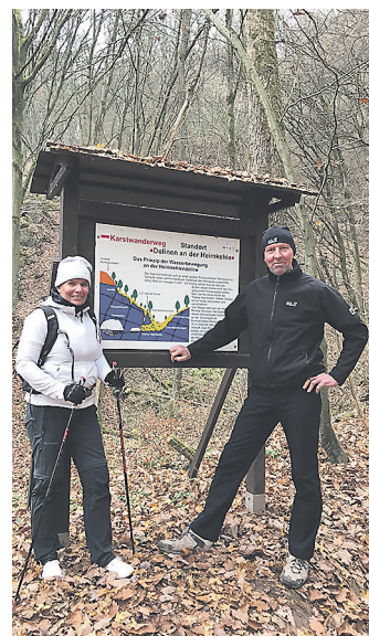
Beim Wandern erleben wir alle Jahreszeiten hautnah und tanken Energie.