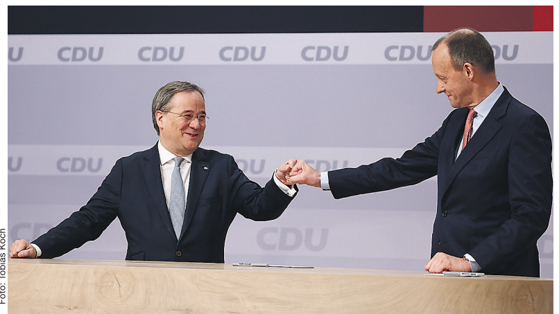
Armin Laschet nennt Friedrich Merz „das wirtschafts- und finanzpolitische Gesicht der CDU“ und kündigt an, ihm eine Schlüsselrolle in der Bundesregierung zu übertragen. Damit gilt im Falle eines CDU-Wahlsieges Merz' Berufung zum Finanz- oder Wirtschaftsminister als sicher.